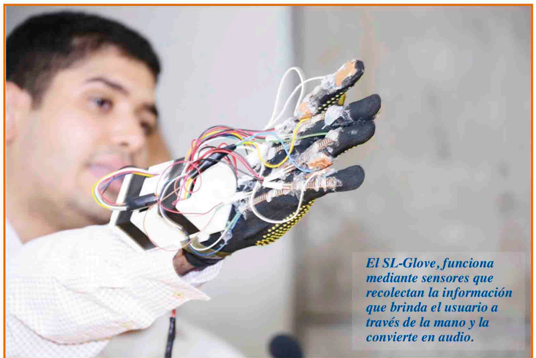
El SL-Glove, funciona mediante sensores que recolectan la información que brinda el usuario a través de la mano y la convierte en audio.

El prototipo de guante, que fue presentado en INTEC en octubre pasado, permite traducir lenguaje de señas, utilizados por las personas sordas para comunicarse, a voz, de esta manera les permite mejorar su calidad de vida. Para lograr dicho objetivo, los innovadores dominicanos se auxiliaron en la bases datos de patente, que les permitió conocer las diversas