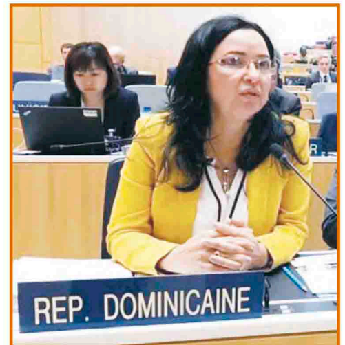
La doctora Sandy Lockward, directora de ONAPI, durante su alocución en 59° Asamblea de Organización Mundial de la Propiedad Intelectual.