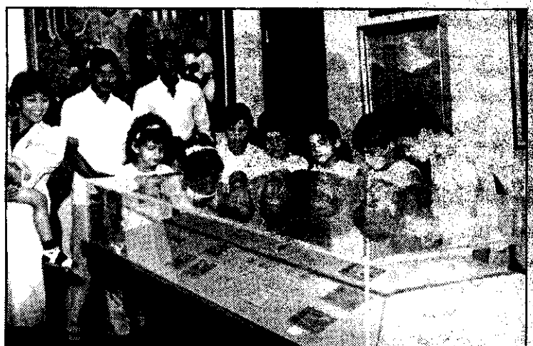
■ Un grupo de escolares observa la colección de billetes haitianos durante la exhibición "200 años de numismática haitiana".

Recorriendo las distintas salas conocemos datos interesantes: podemos apreciar las fichas que servían como moneda en las bodegas de los ingenios y con las que se pagaban a los cortadores de caña. Estas fichas metálicas están orificadas en el centro con el fin de que los obreros pudieran enlazarlas con un cordel y llevarlas colgadas de la ropa.