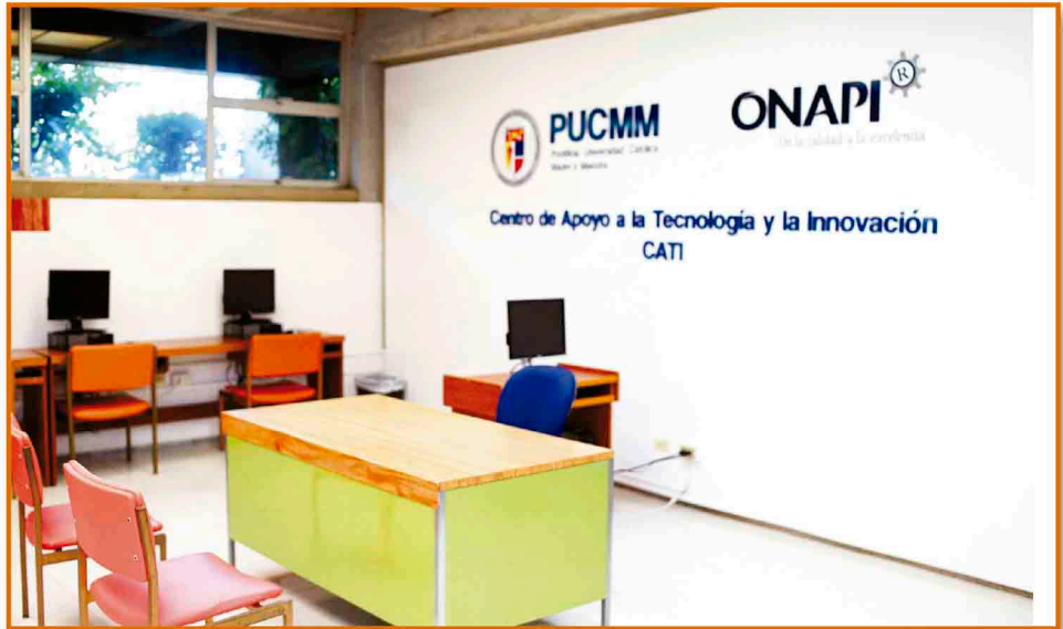
Imagen del CATI Periférico.