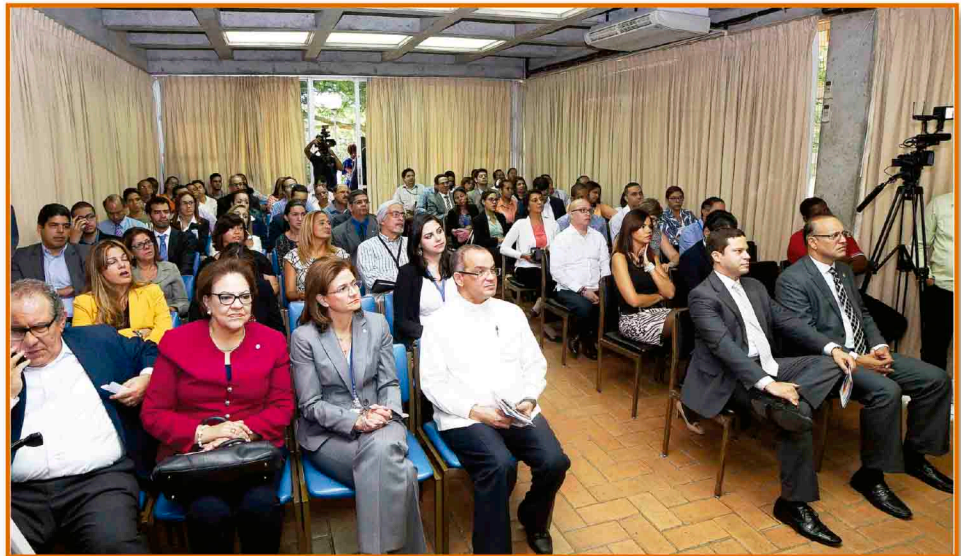
La actividad contó con la presencia de vicerrectores, decanos y personal docente de la PUCMM, vicerrectores e invitados especiales de otras universidades.