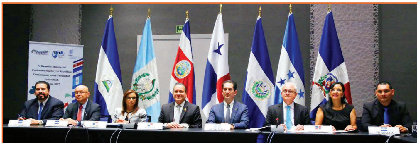
Centroamérica y República Dominicana firman declaración para continuar fortaleciendo el Sistema de Propiedad Intelectual en la región.