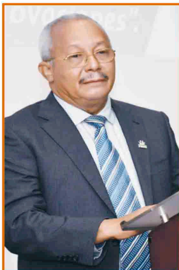
Director de ONAPI al momento de dirigirse a los presentes.

Ese estudio colocó a Dominicana por encima de naciones como México,