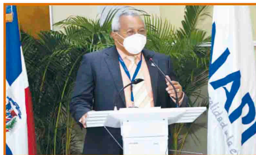
El director general de ONAPI, al momento de dirigirse a los presentes durante el acto de entrega del certificado de marca colectiva.