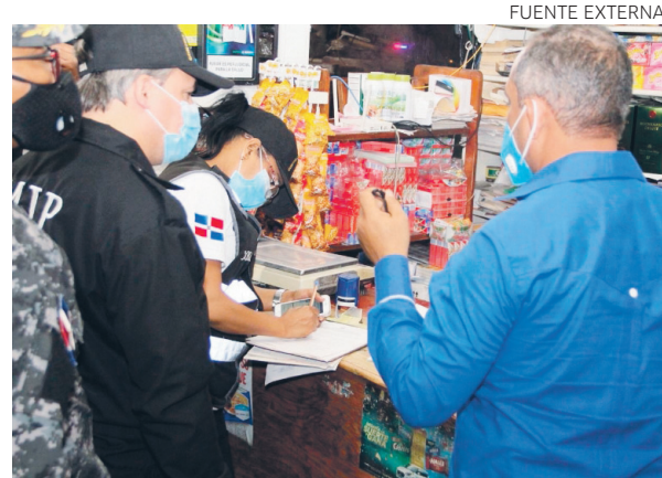
Oficiales del COBA notifican al dueño de un negocio.

Se espera que un juez les conozca medida de coerción a los imputados en las próximas horas, para que respondan por el hecho que se les imputa.●