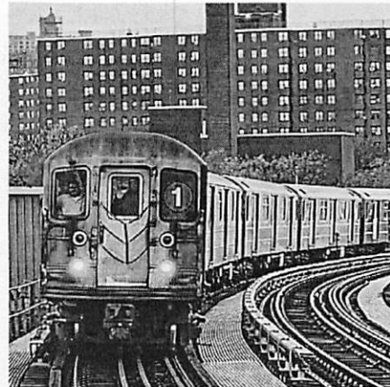
Línea número uno del tren de Nueva York.