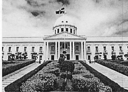
El presidente Luis Abinader firmó los decretos este mes.

Uno de los considerando del decreto destaca "que en fecha 21 de diciembre de 2020, el Gobierno y el CMD firmaron un acuerdo, mediante el cual, se pactó un aumento sustancial de las pensiones de los médicos que han laborado en el sis-