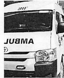
La ambulancia donada.

HERMANAS MIRABAL. - El Gobierno dispuso la entrega de una moderna ambulancia para el hospital Pasasio Toribio Piantini, de Salcedo, totalmente equipada con tecnología de última generación, con el objetivo de salvar vidas apoyando al Servicio Nacional de Salud y el Sistema 9-1-1 en la provincia Hermanas Mirabal.