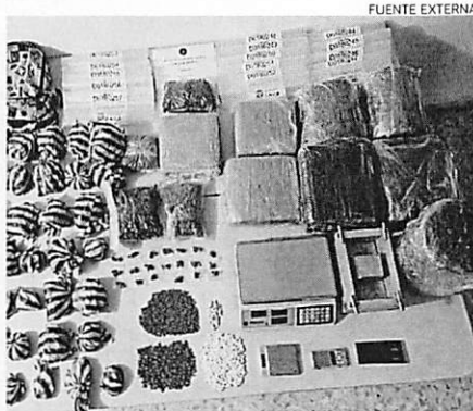
Distintos tipos de drogas incautadas por la DNCD.

En estas acciones conjuntas, dirigidas a enfrentar y detener el tráfico y venta de drogas, las autoridades decomisaron 212 armas de fuego, entre ellas pistolas, revólveres y escopetas, 565 armas